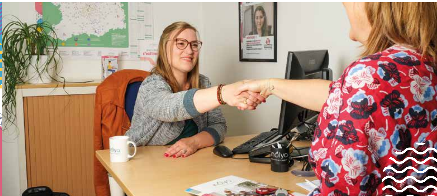
Inolya a obtenu le label Livia qui récompense notre qualité de service auprès de nos locataires.