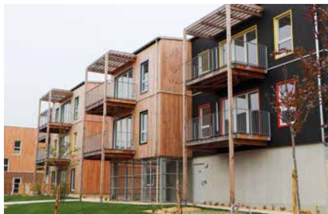
Les nouveaux logements écoresponsables du quartier Rethel à Caen.

Courant avril, 28 familles ont emménagé dans de nouveaux logements situés dans le quartier Rethel. Tous les logements sont traversants et organisés autour d'un espace vert central. Les nouveaux locataires bénéficient d'une pièce de vie spacieuse et d'une cuisine ouverte sur le séjour. Pour offrir un confort optimal et une meilleure maîtrise des charges de chauffage, cette résidence est labélisée bâtiment à énergie positive (Label QUALITEL BEPOS Effinergie 2017 - E3C2). En clair, elle produit plus d'énergie primaire qu'elle n'en consomme. Elle a également été construite avec des matériaux naturels (Label Bâtiment Biosourcé de niveau 2).