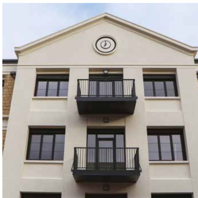
Avec la Cartoucherie, l'ancien site du Service de Santé des Armées a été transformé en logements.

La Cartoucherie, ancien site du Service de Santé des Armées de Mondeville désaffecté depuis plusieurs années, débute sa nouvelle vie. 56 familles ont intégré au cours du mois de mars ce bâtiment transformé en logements par Inolya. Le projet valorise l'architecture des années 20 tout en y apportant la modernité, le confort et la performance des réalisations actuelles.