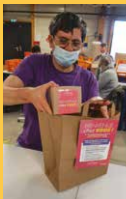
L'ESAT de l'APAEI réalise les Packs Premiers Jours remis lors des états des lieux.

Dans le cadre de notre politique achats responsables et de notre démarche de responsabilité sociétale des entreprises (RSE), Inolya est engagé dans un partenariat avec l'Établissement et Service d'Aide par le Travail (ESAT) de l'Association de Parents et Amis d'Enfants Inadaptés (APAEI) de Caen.