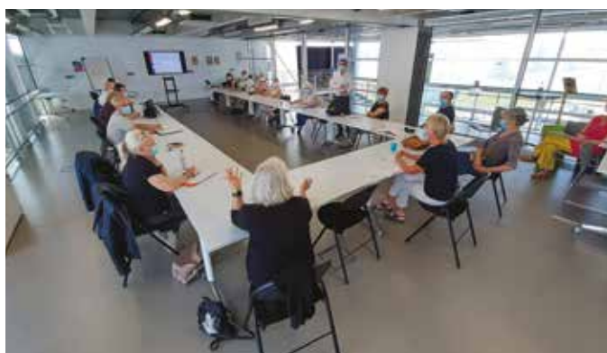
Un groupe d'habitants de l'îlot Trébucien échange sur le futur de leur résidence sur le port de Caen.

Prochaine étape : la présentation du projet aux habitants au dernier trimestre 2022.